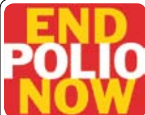
"End Polio Now" koncert 26.02 · KL. 15-17.30