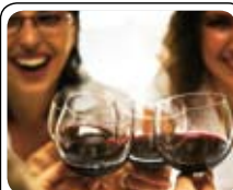
Ladies Night - Vinaften 01.06 · KL. 18.00