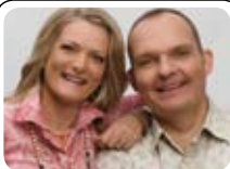
Grill med Glæsel Spisning, grillshow & dans 29.04 · KL. 18.00