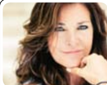
Lis Sørensen med band 23.02 · KL. 20.00