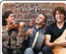
Tradish - Irsk aften 16.06 · KL. 18.00/20.00