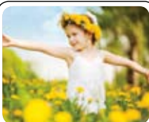
Syng Sommeren ind 26.05 · KL. 19.30