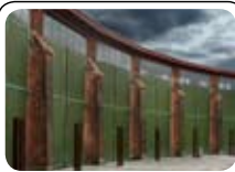
Generalforsamling & Medlems- aften i Foreningen Kulturremisen 23.03 · KL. 19.30