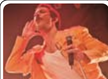
Queen Machine 06.05 · KL. 20.00