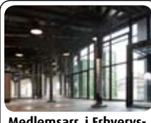
Medlemsarr. i Erhvervs- klubben "På Skinner" 18.05 · KL. 17.30