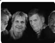
Nalle & his crazy Ivans 11.02 · KL. 20.00