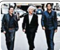
Everybody's Talking 04.03 · KL. 20.00