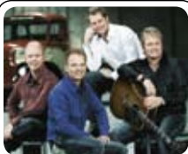
Koncert med Kandis 17.05 · KL. 20.00