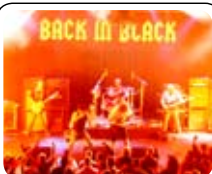
Back in Black 01.04 · KL. 20.00